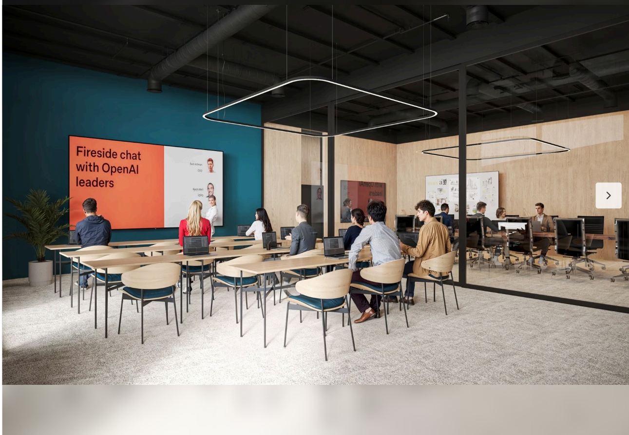
Illustrasjonsfoto Motion studiesenter FOTO: ILLUSTRASJONSBILDE

Ole Henrik Golf trekker fram at denne fleksibiliteten også gjør senteret til et viktig verktøy for næringslivet i regionen.