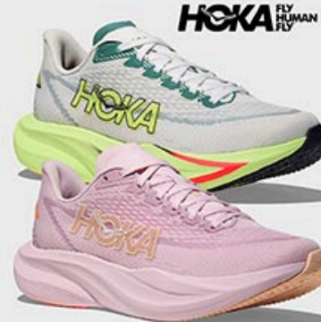
HOKA MACH 7 / 1999,-