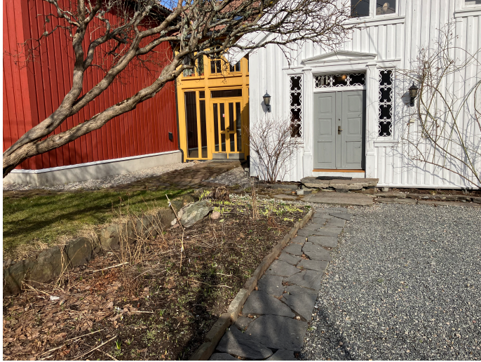
Inngang fra vest inn til Meta Hansen Parken og Meta Hansens Hus: