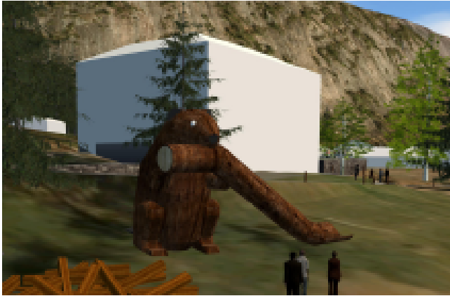
Illustrasjon 2: Trollvegg har illustrert hvordan beverlandemerket foran Elvarheim kan se ut. Endelig utforming vil avhenge av endelig valg av leverandør og endelig godkjenning fra Agder Fylkeskommune.