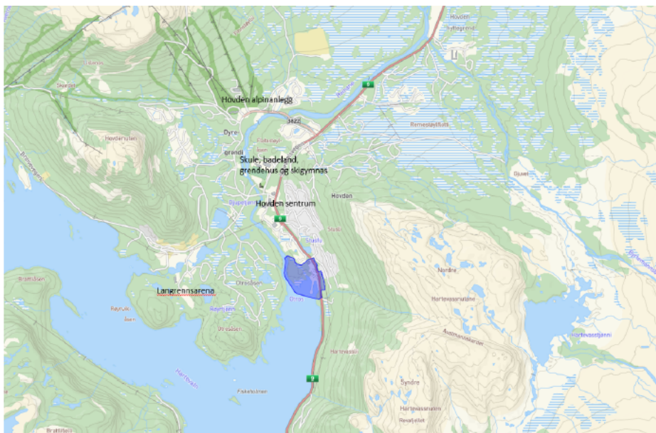
Kart 1: Kartet syner planområdet sin beliggenhet. Planområdet er markert med blått.

Føremålet med områdereguleringsplanen er å leggje til rette for destinasjonsutvikling, friluftsliv, næring-, natur og kulturbasert områdebruk. Hegni ligg ca. 1 km sør for Hovden sentrum, sjå kart nedanfor. Området er svært verdifullt for mellom anna friluftsliv, folkehelse, arkeologi og interesser knytt til barn og unge. Området har verdi både for innbyggjarane i Bykle og for besøkande.