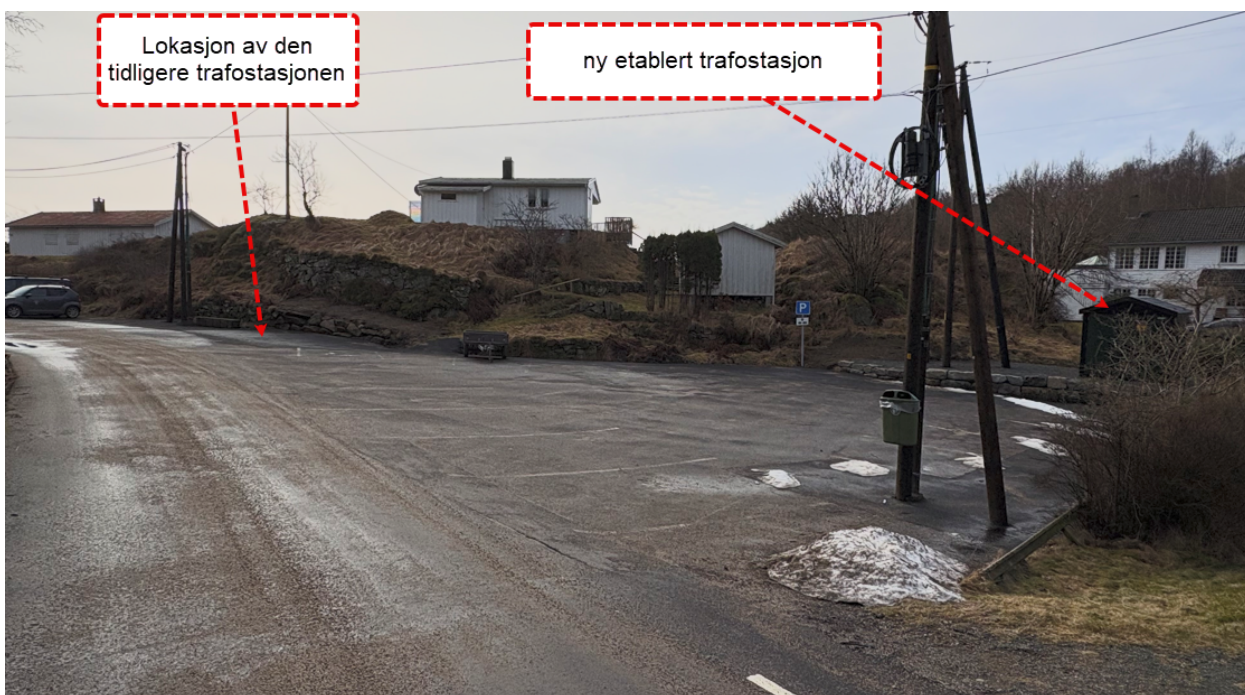
Bildet viser området slik det ser ut i dag.