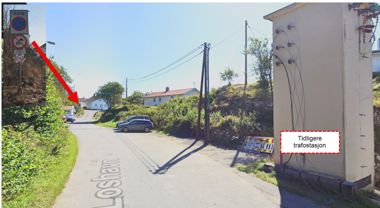
Bildet viser området slik det så ut i fjor, før trafostasjonen ble fjernet. Soneforbud skilt sees i bakgrunnen.