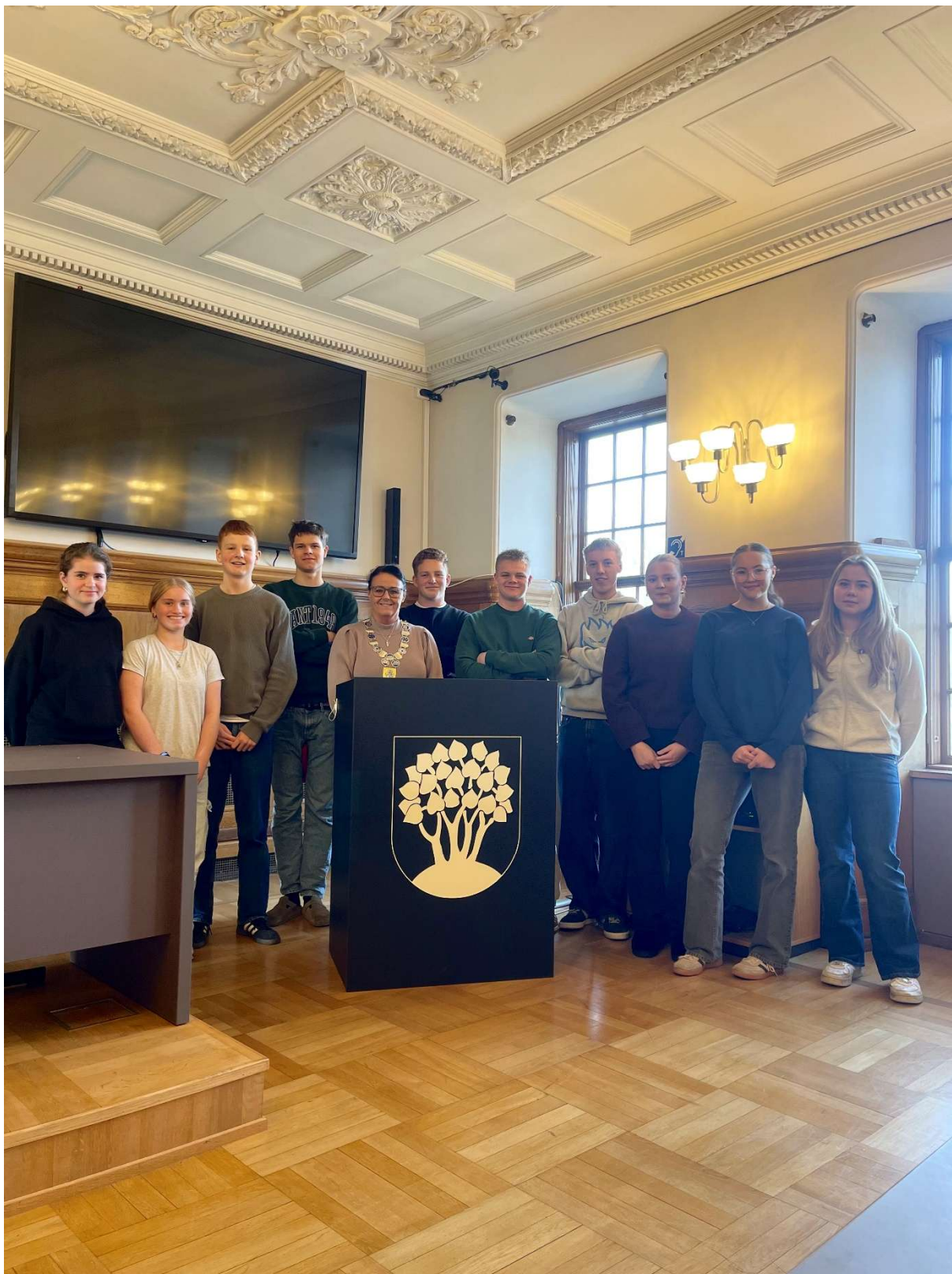
Farsund ungdomsråd skoleåret 2025/2026