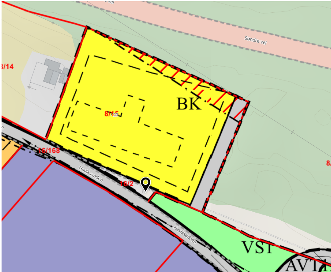
Over: dagens situasjon