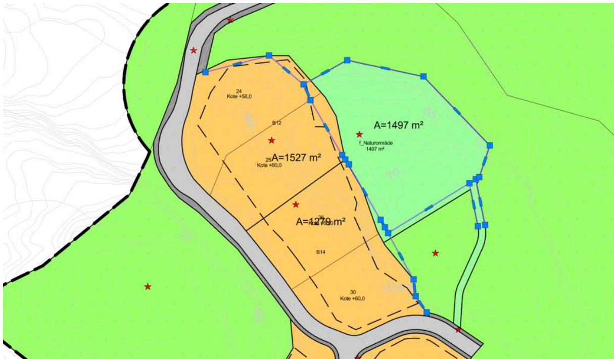
Sammenstilling ny og gammel formålsgrense.

Ved sammenstilling av gjeldende plans formålsgrenser ser vi at det er foretatt en justering langs tomtens østre side, som illustrert under. Denne illustrasjonen viser med blå markert linje hvor gjeldende plans formålsgrenser går, på toppen av revidert plankart.