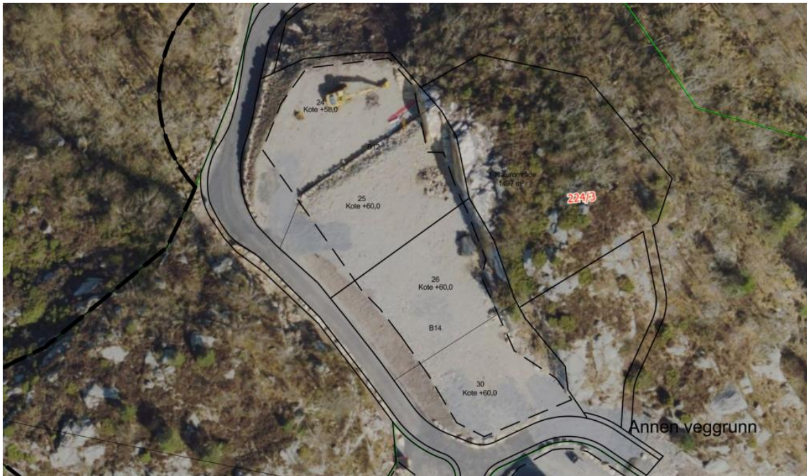
Orto kombinert med plan.

Vi har her tatt utgangspunkt i faktiske skjæringsflater i øst, samt opparbeidede skråninger mot vei i vest, og foreslått en byggegrense som tar utgangspunkt i de opparbeidede flatene som vises i fotoet. Videre har vi satt formålsgrensen akkurat utenfor de vi ser som bearbeidet terreng.