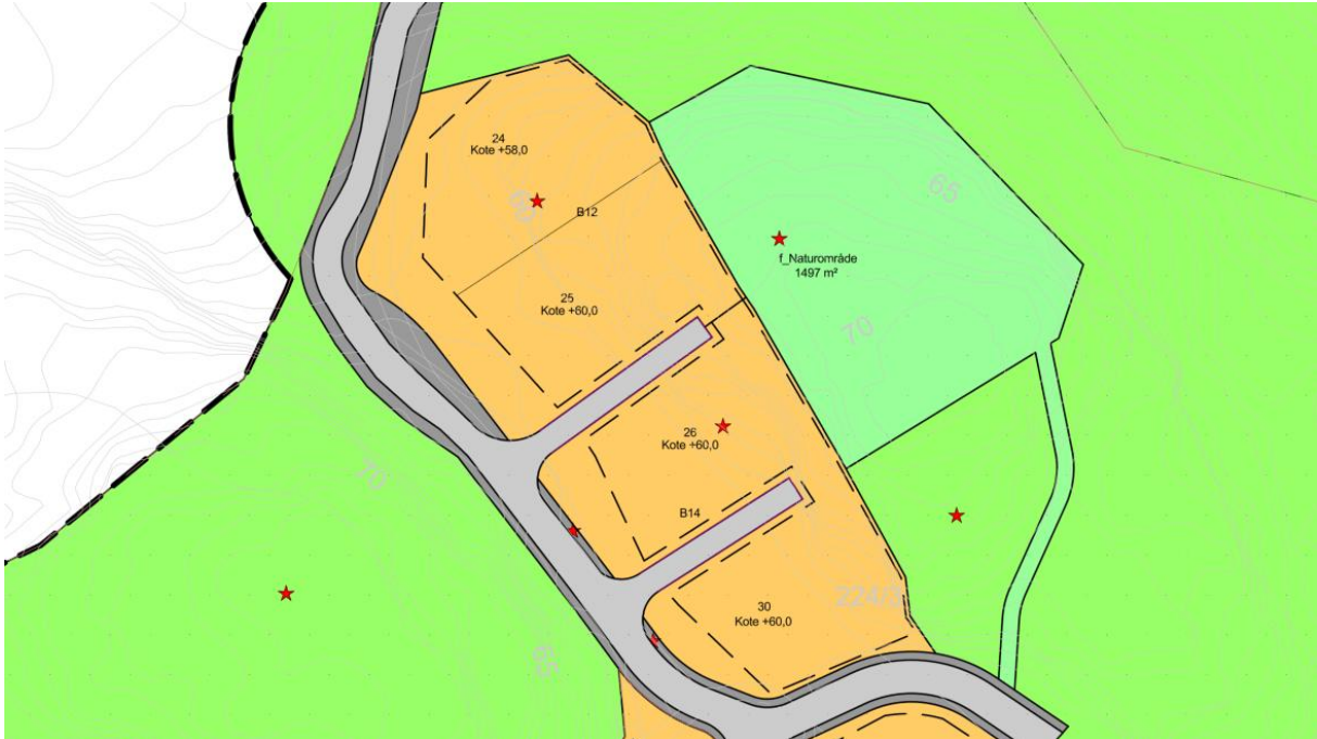
Utsnitt gjeldende plankart.

Det er gjort justeringer av formålsgrenser og byggegrenser på tomtene 24, 25, 26 og 30 slik at disse samsvarer med faktiske forhold etter opparbeidelse. Det er i tillegg fjernet formålet «Annen veggrunn – tekniske anlegg» mellom veibane og disse tomtene, samt tatt bort veiformålet som i