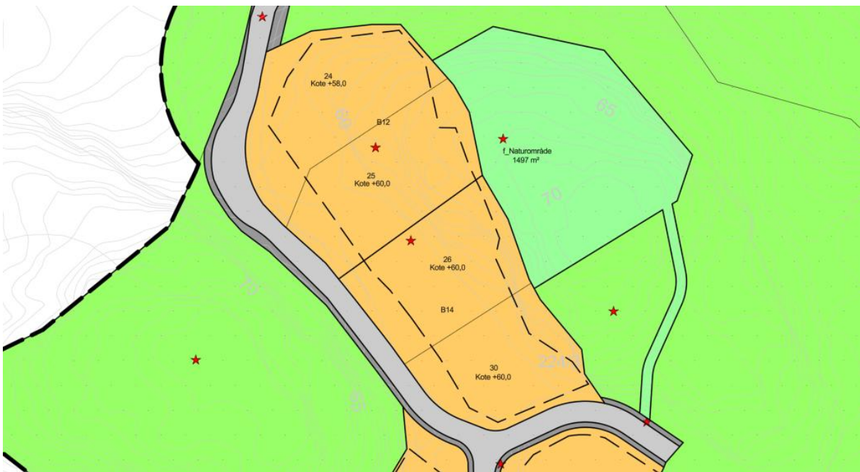
Utsnitt revidert plankart.

Ved fastsettelse av de endrede formåls- og byggegrensene har vi gjort en sammenstilling av ortofoto og reguleringsplanen, og på bakgrunn av dette justert grensene som vist under: