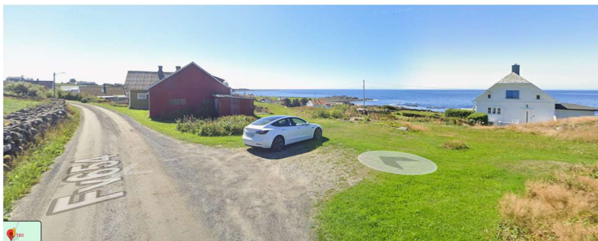
Over: Eksisterende avkjørsel som blir benyttet. Eldre bolig og låve ved Fylkesveien.