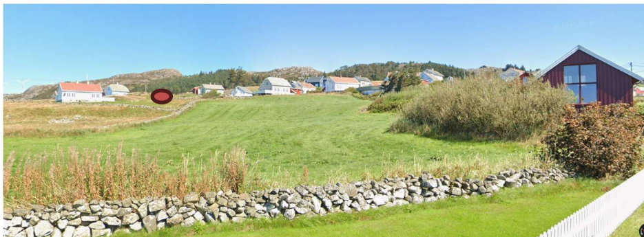
Over: Deler av eksisterende bebyggelse på Jølle sett fra sør/vest. Rød sirkel markerer ca. plassering for ny bolig og garasje.