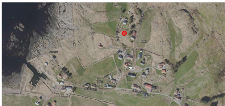
Over: Bebyggelsen på Jølle. Rød sirkel markerer området for nytt tiltak.

Plasseringen gir gode sol- og utsiktsforhold mot sørvest for både tiltakshaver og nabo i nord, samtidig som den ivaretar avstand til nabobebyggelse, skaper romlighet og privatliv, og bidrar til en helhetlig og stedstilpasset videreføring av bebyggelsen. Øvrig bebyggelse ligger betydelig lenger unna og vil ikke bli berørt.