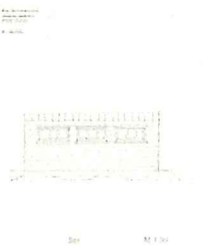
Hagestue Sør.jpg 1553K