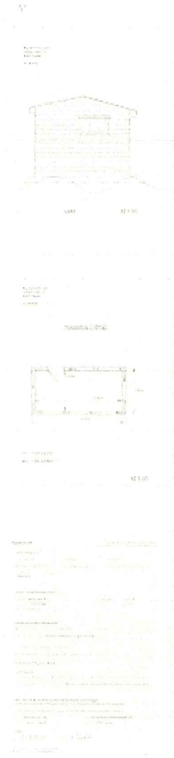
Hagestue Vest.jpg 1507K