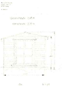
Hagestue Øst.jpg 1571K