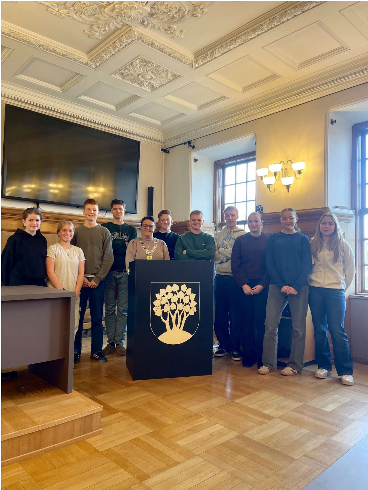
Farsund ungdomsråd skoleåret 2025/2026