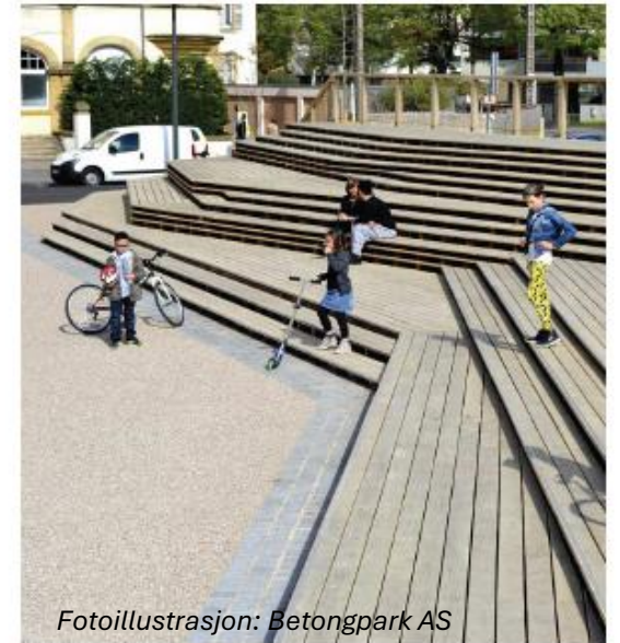
Fotoillustrasjon: Betongpark AS