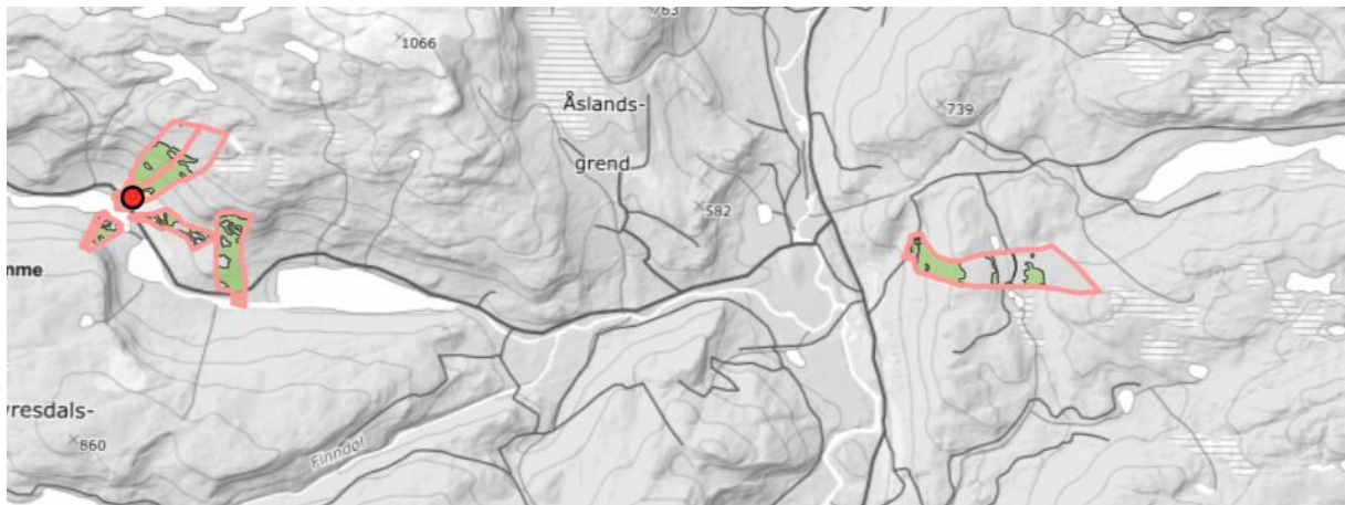
Figur 2. Utklipp fra kart som viser Geitstad til høyre, med nåværende driftssenter Askerud til venstre.