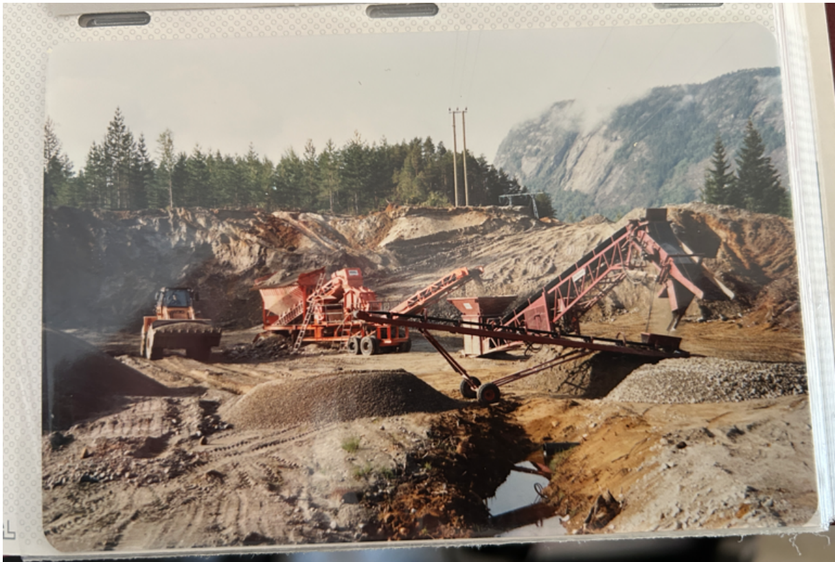
Bilde frå drift på staden ca 1990

Tiltaket vurderes til å ha låg påverknad på miljøet. Det er ikkje kjente sårbare naturtyper eller kulturminne i området.