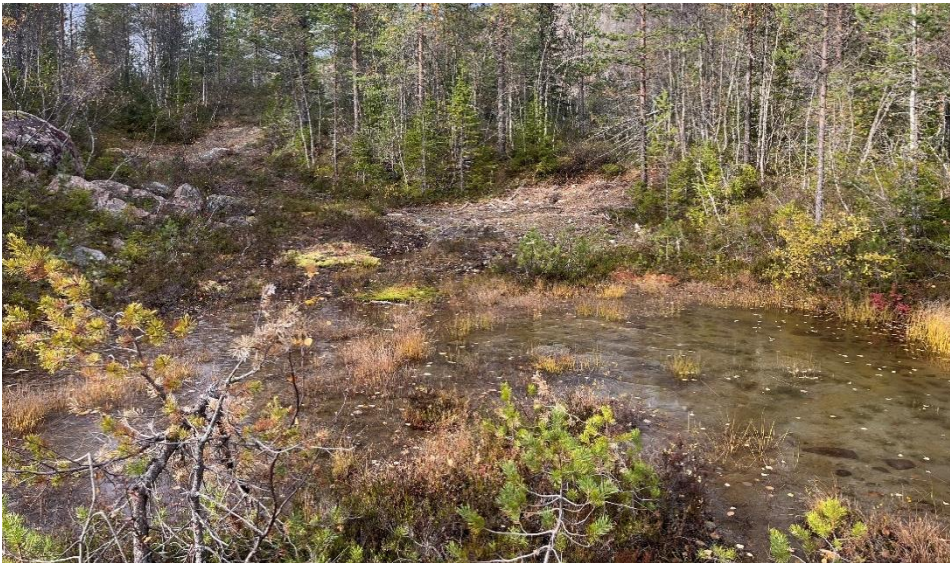
Bilde: Gammelt massetak Skåltjønn. Planlagt utvidelse er i bakkant av gammelt massetak. Kantsone mot vassdrag beholdes.