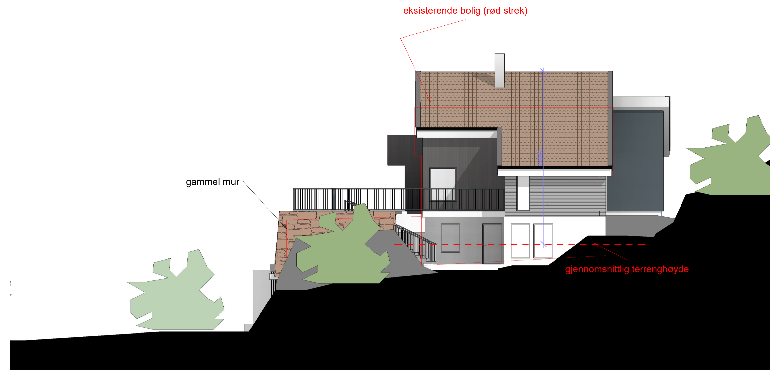
Fasade Øst 1:100