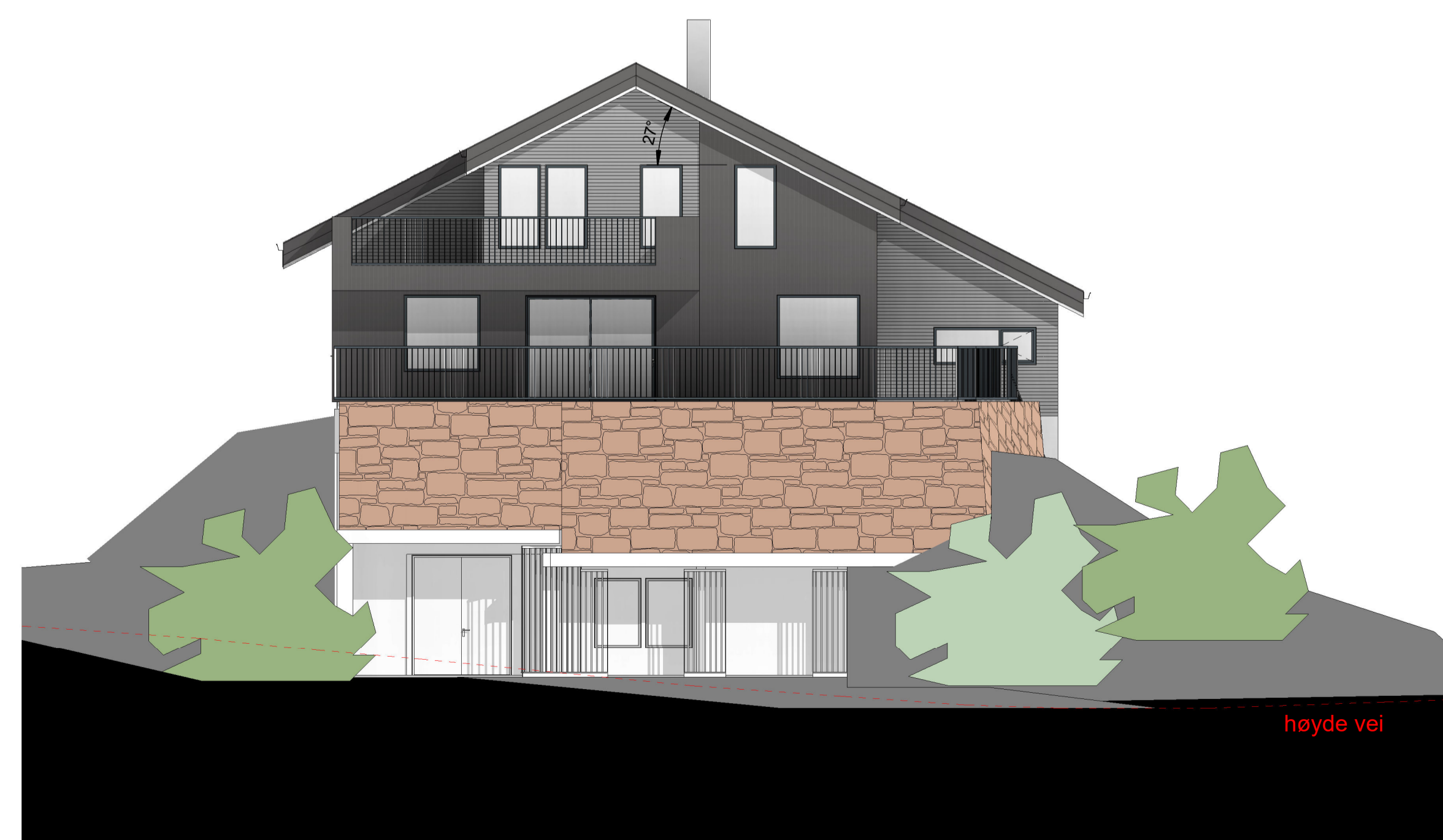
Fasade Sør 1:100