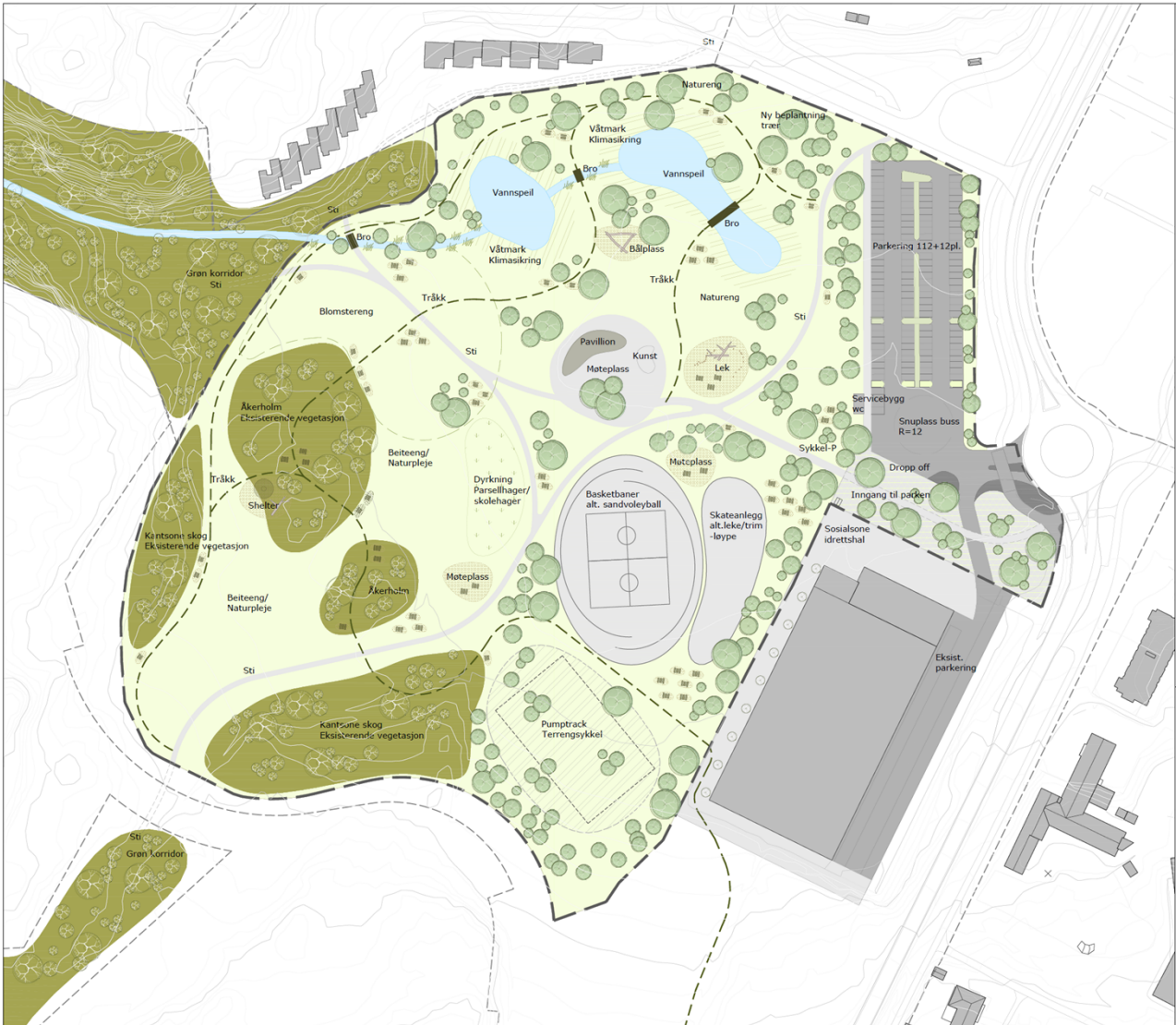
Figur 4: Utomhusplanen som viser utformingen av campus park slik den var foreslått regulert