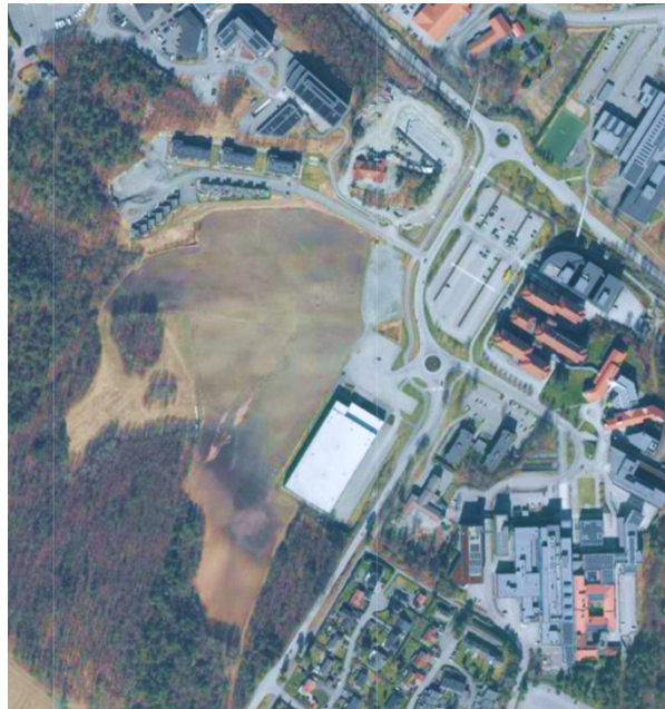
Figur 2: Campusområdet 2025

Figurene 1 og 2 viser utviklingen i området de ti siste årene.