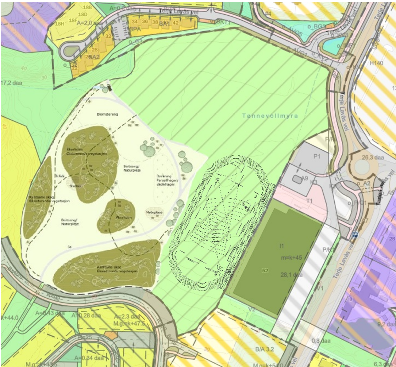
Figur 7: Skissekonsept 2

Figur 7 viser et kladdet konsept for hva man kanskje kan få til hvis man prioriterer fridrett og samtidig klarer å avsette noe areal til park mellom åkerøyene.