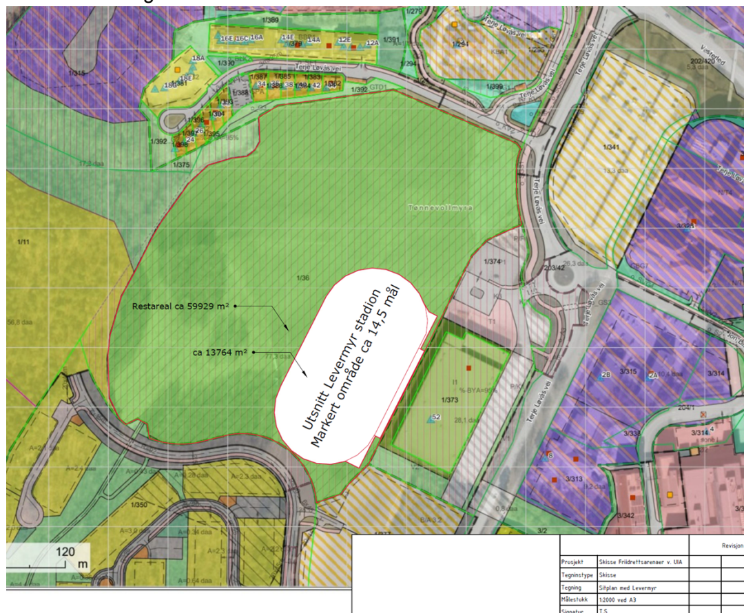
Figur 5: Størrelsesberegning

Figur 5 viser størrelsen på friidrettsanlegg med 6 bredder av løpebane