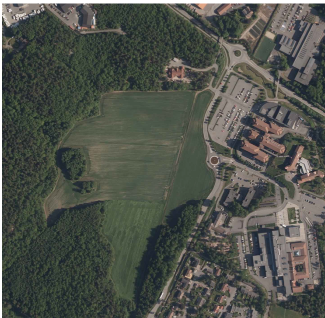
Figur 1: Campusområdet ca 2015

Kommunedirektøren anbefaler at kommunen tar et tydelig ansvar for å avklare et realistisk mulighetsrom i dialog med Statsforvalteren, private aktører og UiA, før det eventuelt fremmes sak om bevilgning for å slutføre planarbeidet. En slik trinnvis tilnærming reduserer risikoen for å bruke store ressurser uten avklart akseptgrunnlag, samtidig som kommunen aktivt ivaretar campusområdets potensial og strategiske betydning for langsiktig utvikling i Grimstad.