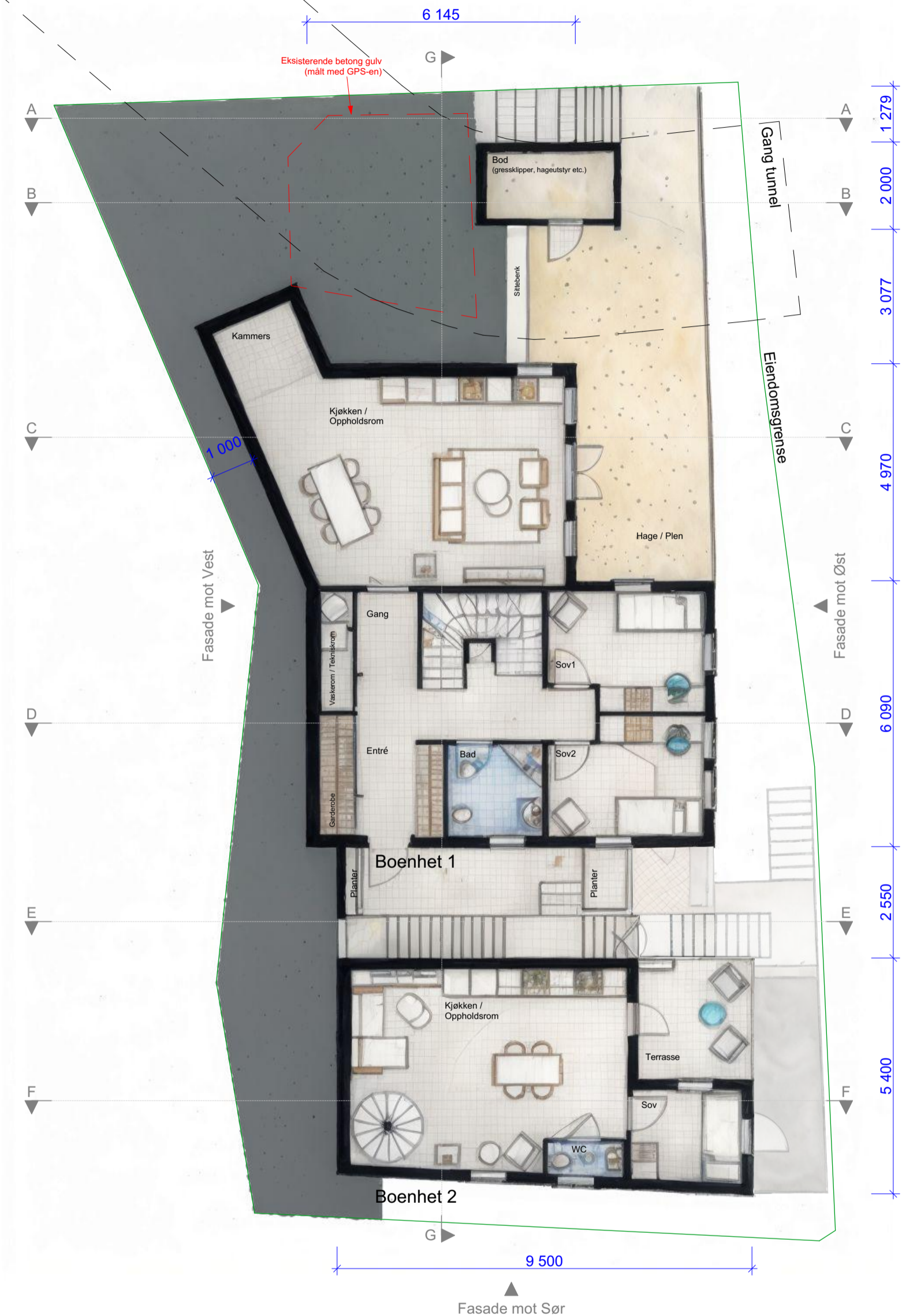
Arealoppgave - Boenhet 1