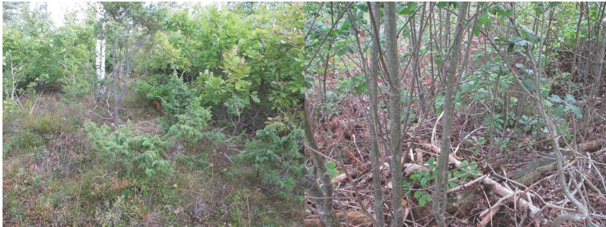
Foto 2 Tett vegetasjon på vestsiden av Moyodden