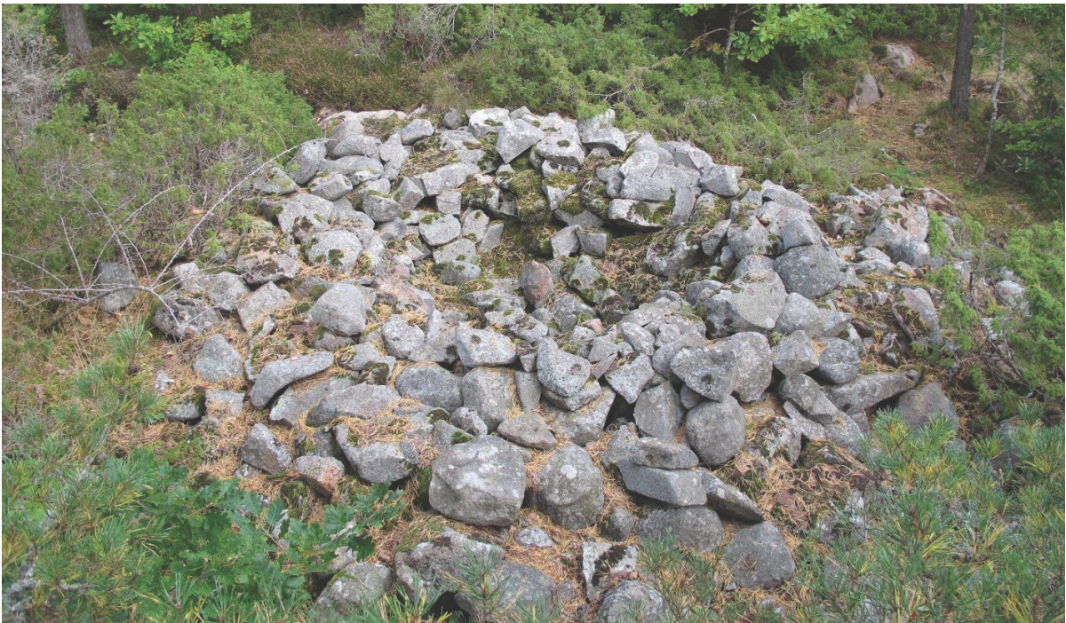
Foto 4 Gravrøys 4104