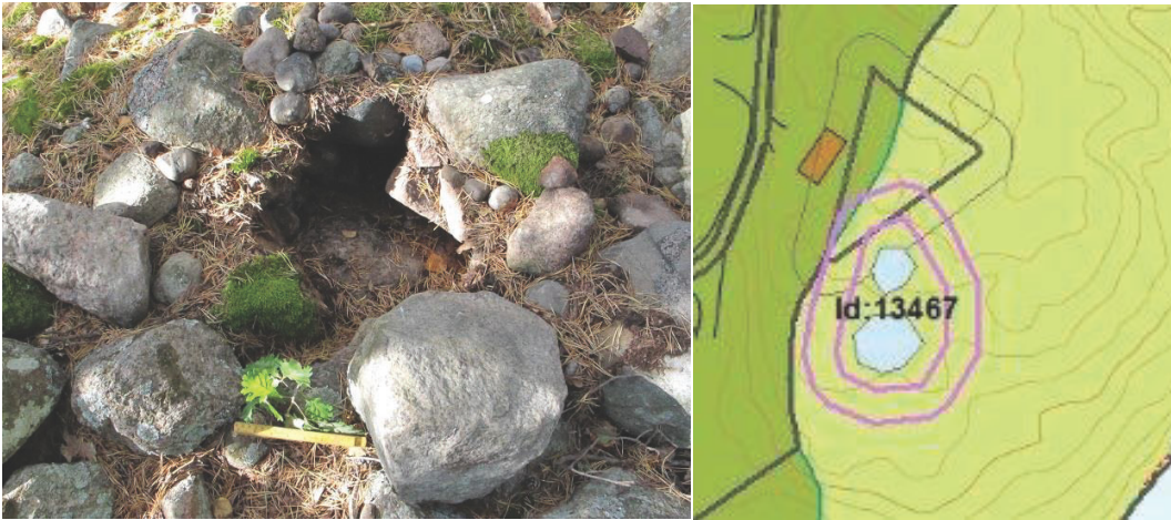
Foto 8: Til venstre liten grop i 13547-2, til høyre gammel og ny kartfesting