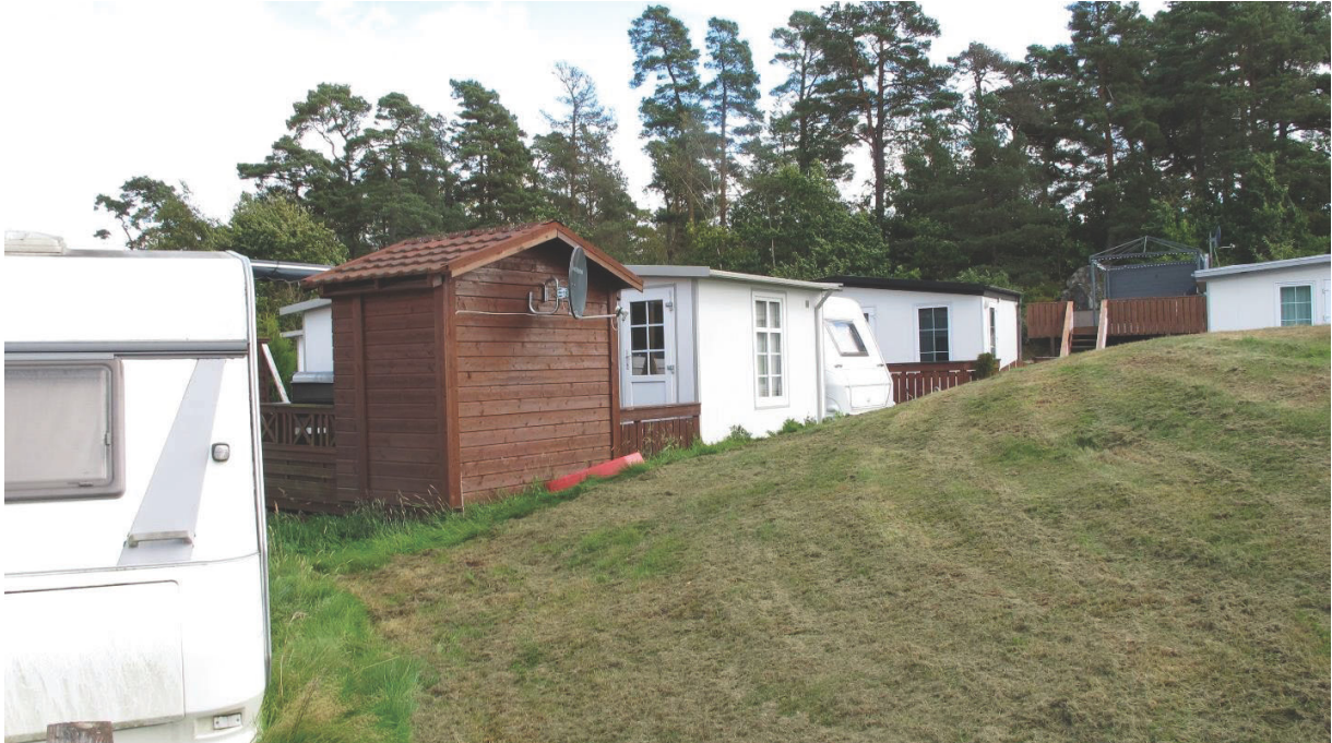
Foto 6 Id: 4105-1 gravhaug inneklemt mellom campingvogner, bilde mot nordøst-

Tilstand haug 2, 4105-2: Tapt/fjernet- Ikke gjenfunnet.