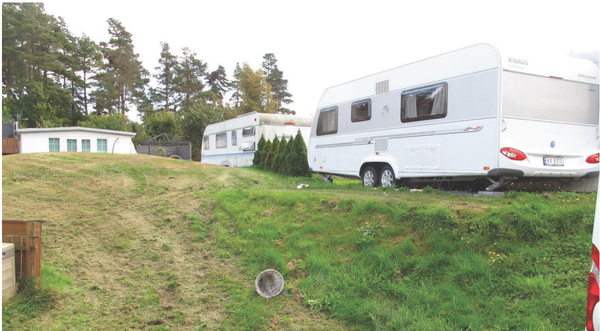
Foto 5 Foto 5 Id: 4105-1 gravhaug inneklemt mellom campingvogner, masse påfylt. Bilde mot sør.

Tilstand haug 1, 4105-1 , Gravhaugen ligger inneklemt mellom campingvogner og anlegg i tilknytning til disse. I sørvest er det påfylt noe masse som danner en terrasse som fungerer som fundament for campingvogn. i Vest en asfaltert gangvei i kant med haugen. Haugen ser ut til å være hel, men registrert bruddstein i toppen er fjernet og krateret er utjevnet/fyllt igjen. Haugen er gressbevokst og har slitasjeskade med hull i dekket på toppen av haugen. Sikringssonen er fullstendig tildekket av campingvogner, hageanlegg og diverse.