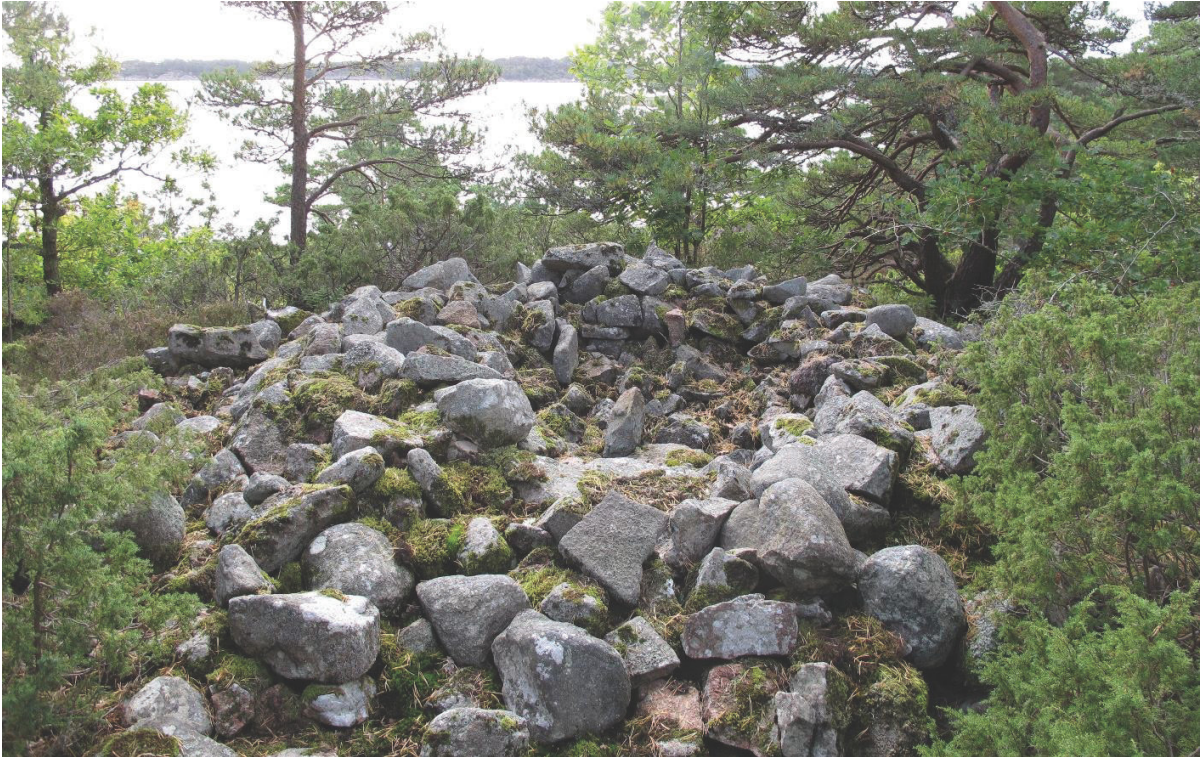
Foto 3 Gravrøys 4104 med utsikt mot sørøst