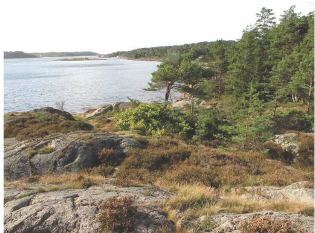
Foto 1 Utsikt fra Moyodden mot sør

Mot havet i sør hever terrenget seg med kupert terreng av knauser og bart fjell. Planområdet østlige del består av Moyodden som i hovedsak består av svaberg og knauser. På toppen, og vestsiden av Moyodden er det et flatere område med tett vegetasjon. Dette området er ikke tidligere undersøkt med hensyn til automatisk fredete kulturminner og ble befart.