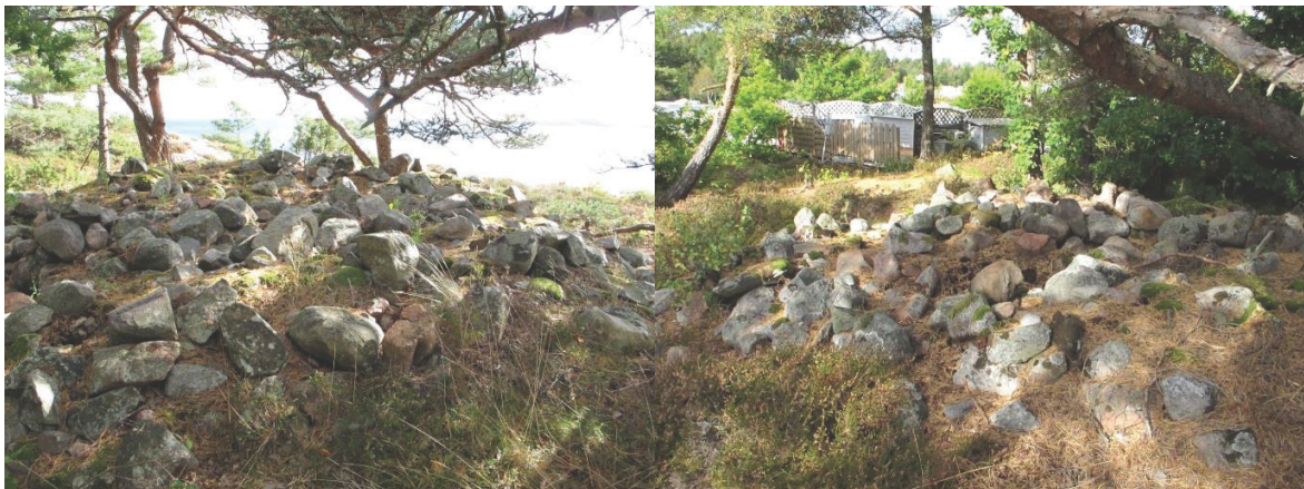
Foto 7 gravrøys 1 er noe utrast, foto mot sør

Lite hull 1x1 m 30 cm dypt gravd i kant av røys mot vest, noe utrast mot sør. Campingvogn med platting og tilbygg i sikringssonen mot nordvest.