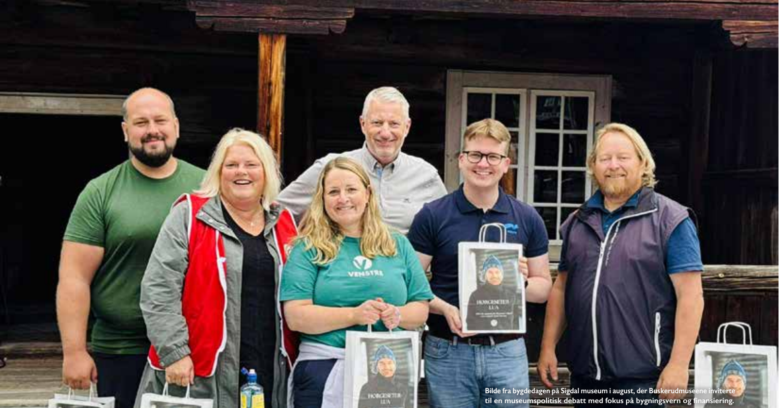
Bilde fra byggedagen på Sigdal museum i august, der Buskerudmuseene inviterte til en museumspolitisk debatt med fokus på bygningsvern og finansiering.