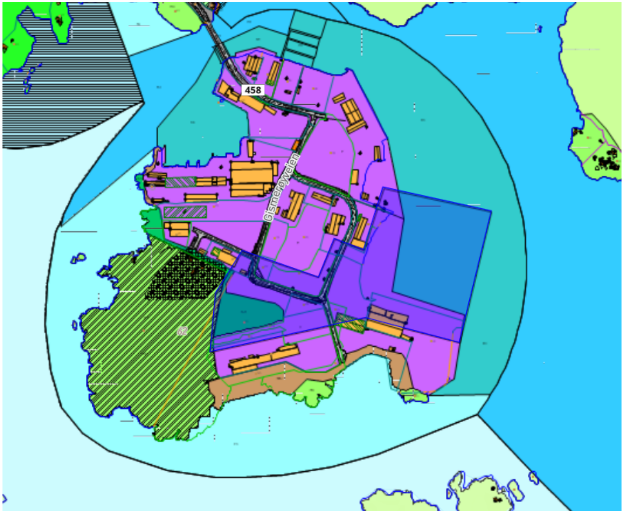
Figur 1: Figuren viser gjeldende regulering for Gismerøya med mørkere markering som viser planområdet for endringen.