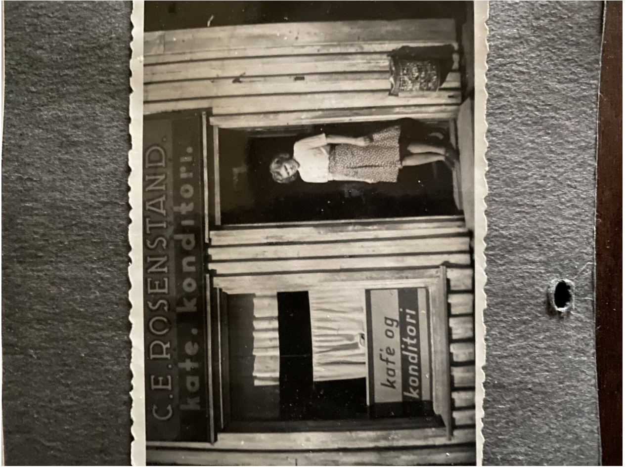
Med vennlig hilsen