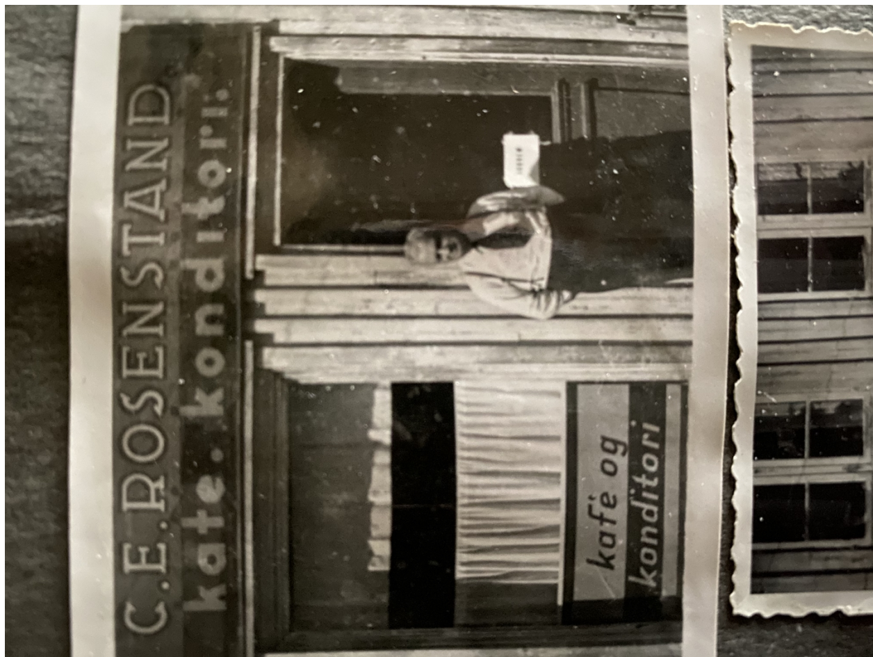
Bilder viser fasade ut mot Ytre Sandgate og kafebord i bakgården.