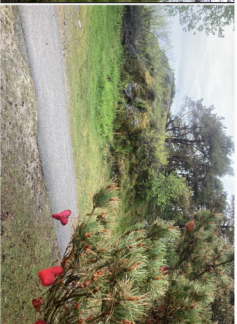
Atkomst fra Lillebanken til Banken