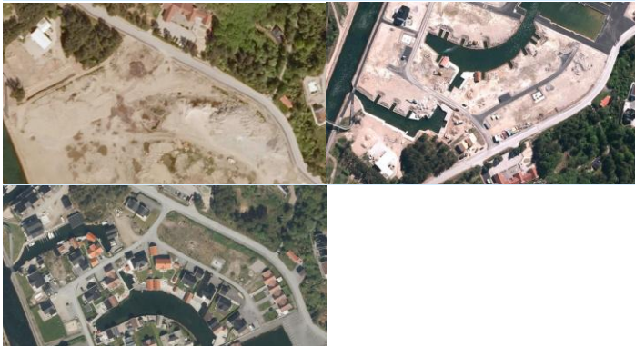
Bilde nr 1 fra 2009 Bilde nr 2 fra 2011 Bilde nr 2 fra 2026

Bildet under viser hvordan området var planert før naturmangfoldloven trådte i kraft.