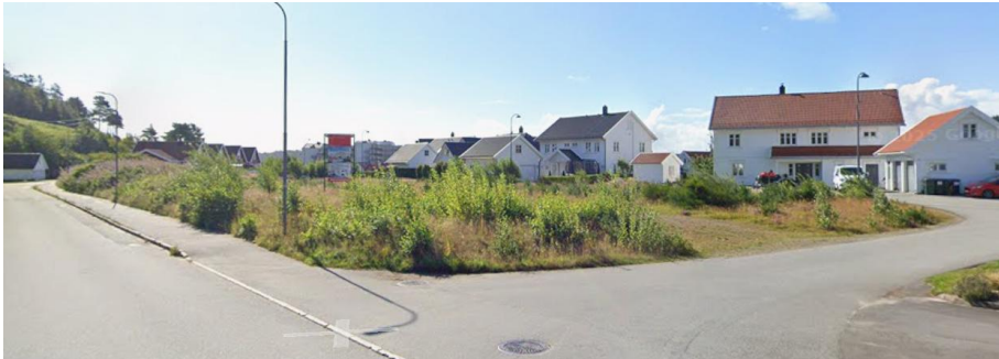
Figur 3 Bildet viser tomtene