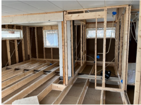
Figur 1. Bilder tatt under befaring den 08.01.2025