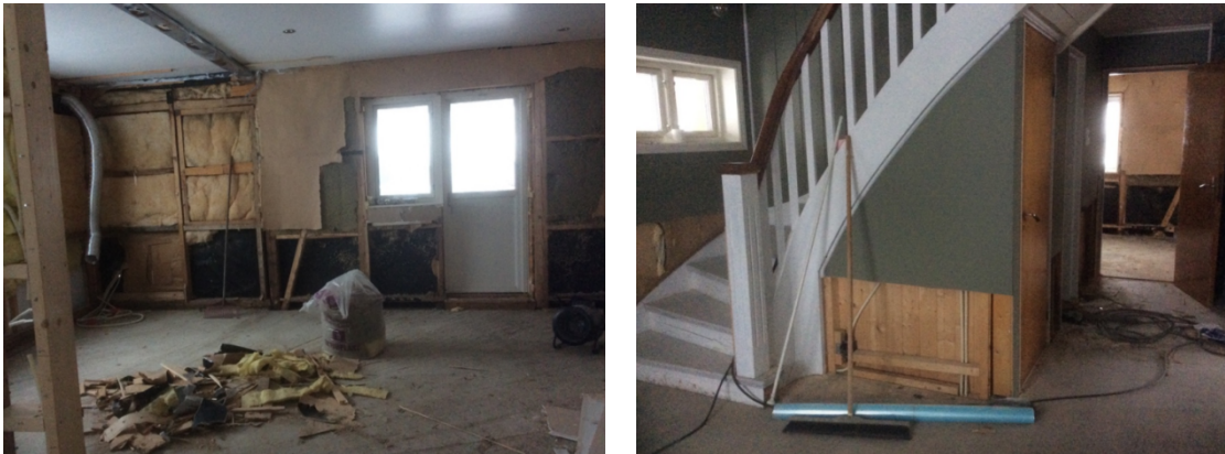
Figur 2. Bilder tatt under befaring den 21.12.2023

Administrasjonen vurderer derfor at tiltakene samlet sett er å anse som en søknadspliktig "vesentlig endring eller vesentlig reparasjon" og «hovedombygging» i henhold til pbl. § 20-1 første ledd bokstav b) og n). Reparasjon av våtrom kan dessuten havne under Plan og bygningslovens §20-1 f) oppføring, endring eller reparasjon av bygningstekniske installasjoner.