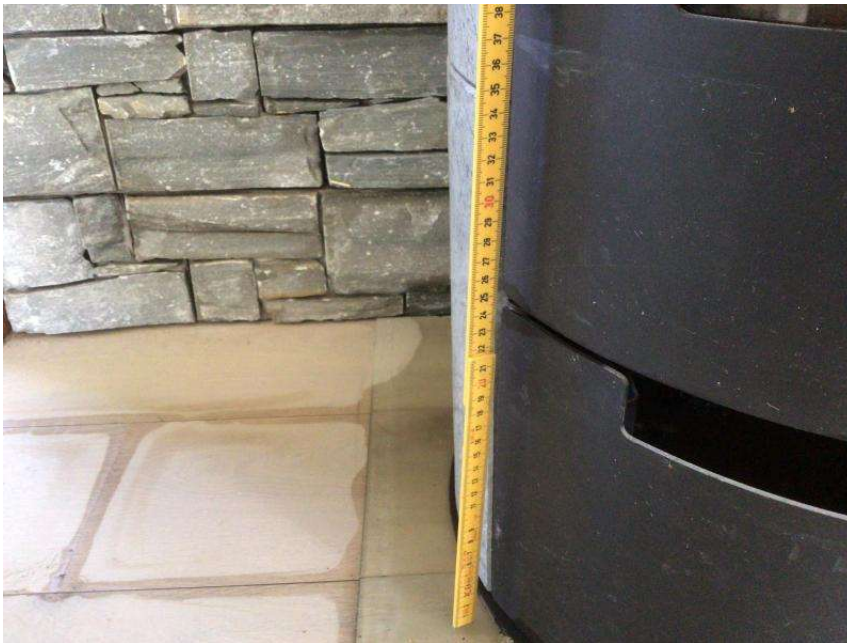
Figur 1 – Fotodokumentasjon

Eneboligen i Øynan 6 ble rammet av ekstremværet «Hans» sommeren 2023. Boligen består av betongkjeller, 1. etasje, 2. etasje og loft. Ifølge rapporten fra Norsk Naturskadepool, datert 02.10.2023, sto det cirka 37 cm vann over gulvet i 1. etasje: