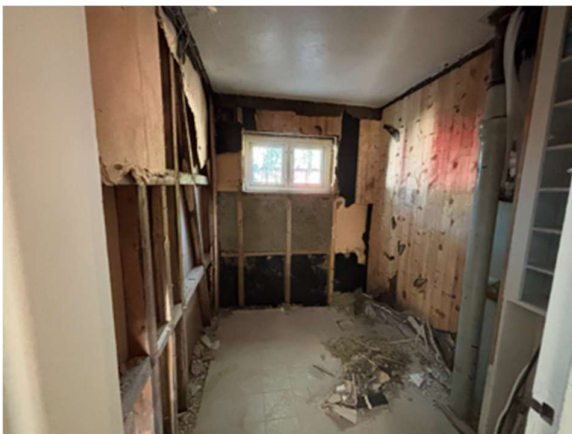
Figur 11 og 12 - Bad