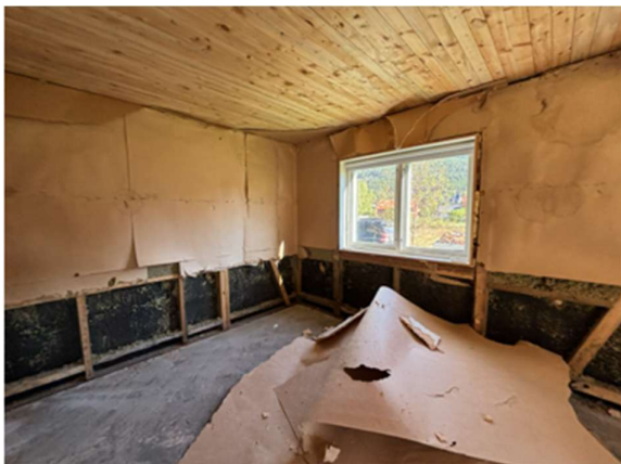
Figur 9 og 10 - Soverom