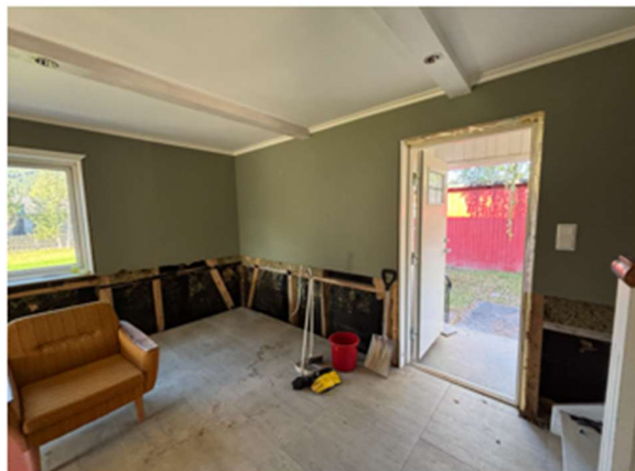
Figur 3 og 4 – Hall, 1. etasje, tatt ved befaring 24. september 2025