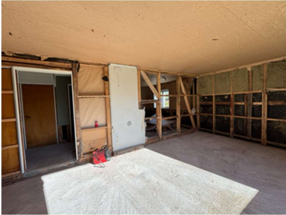
Figur 7 og 8 - Stue