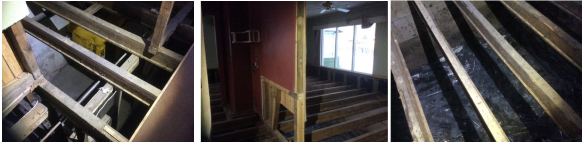
Figur 2. Bilder tatt under befaring den 12.01.2024

Etter dette er tiltakene som er nødvendige å utføre på eiendommen søknadspliktige etter plan - og bygningsloven § 20-2 jf. § 20-1. Tiltakene omfattes av pbl. § 20-3, jf. kapittel 23, og søknaden skal "forestås av foretak med ansvarsrett".