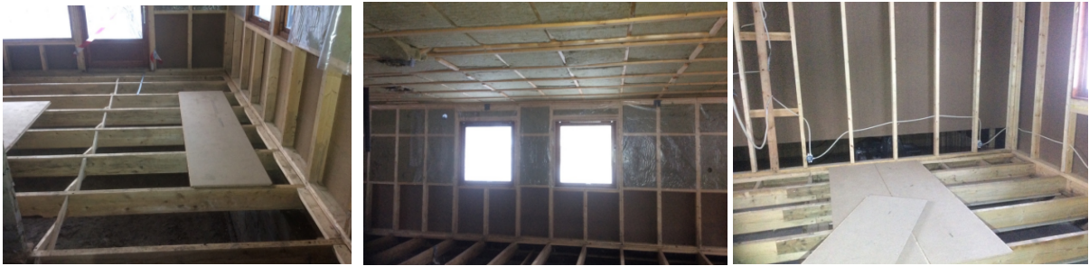
Figur 1. Bilder tatt under befaring den 07.12.2023

Nesbyen kommune bemerker at det er omfanget av rivingstiltakene som allerede er gjennomført som har medført at boligens tilstand er slik at tiltakene er å anse som søknadspliktige.