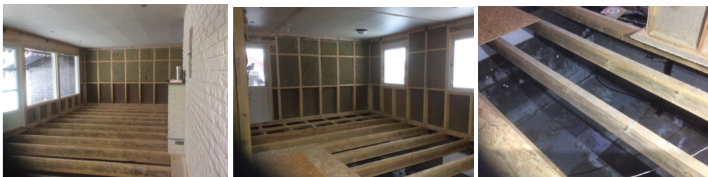
Figur 2. Bilder tatt under befaring den 21.12.2023

Kommunedelplanens bestemmelse punkt 2.6.5 er en hensynssone-bestemmelse for faresone med hensynssonenavn H320_1. Bestemmelsen har hjemmel i pbl. § 11-8, tredje ledd bokstav a.