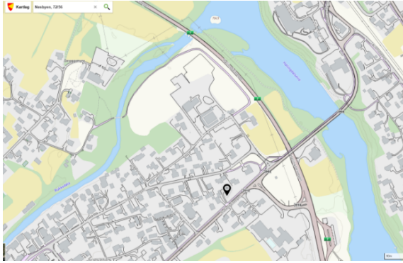
Figur 1. Oversiktskart

Nesbyen kommune gjennomførte befarings på eiendommen den 21.12.2023.