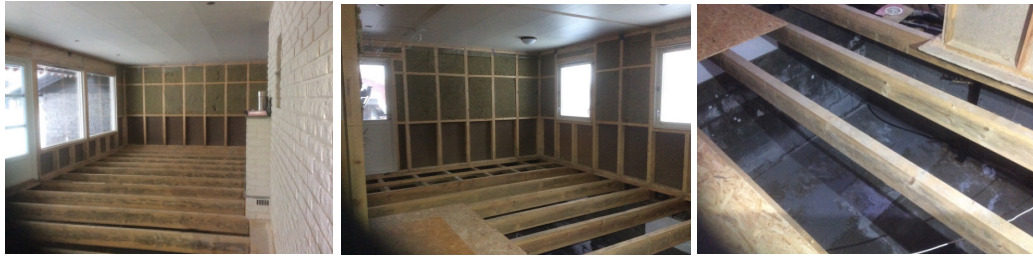
Figur 2. Bilder tatt under befaring den 21.12.2023