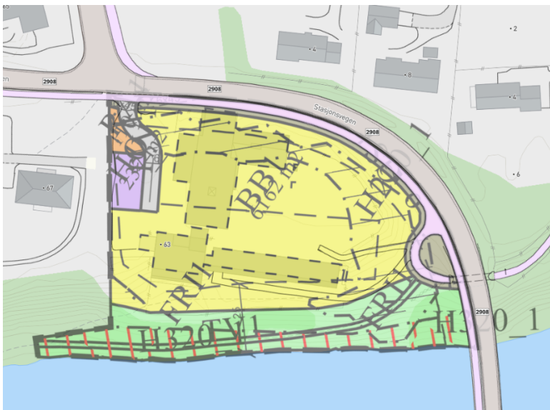
Figur 2. Overordnet plan er kommunedelplan Nesbyen, planID 00201201. Gjeldende reguleringsplan er Østenfor Panorama, planID 01202303