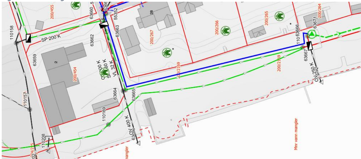
Figur 3 VA-ledninger

Det er vurdert alternativ plassering i bakkant av eiendommen. Men, klubbhuset vil da komme i konflikt med sikkerhetskrav/avstandskrav til eksisterende vann- og avløpsledninger.