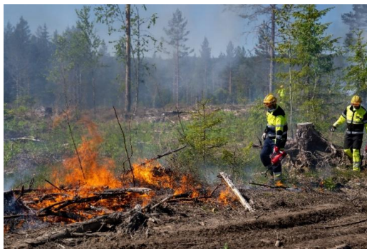
øvelse Ulefoss

Innenfor samfunnssikkerhet har det globale sikkerhetsbildet preget arbeidet, og et stadig fokus fra myndighetene på egenberedskap og hendelser i øvre krisespekter. I Porsgrunn ble beredskapsplanverket på strategisk og taktisk nivå revidert, og implementering i kommunalområdene ble startet. I Porsgrunn var det også tilsyn fra Statsforvalteren på samfunnssikkerhetsarbeidet i desember, og tilsynet ble avsluttet uten avvik. I Bamble ble kommunens helhetlige ROS revidert og vedtatt i 2025.