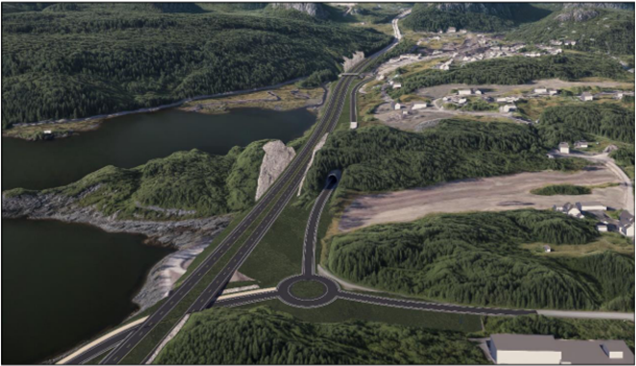
Illustrasjon av planlagt E18 ved Vinterkjær og Akland og kobling til Risørveien, sett fra sør