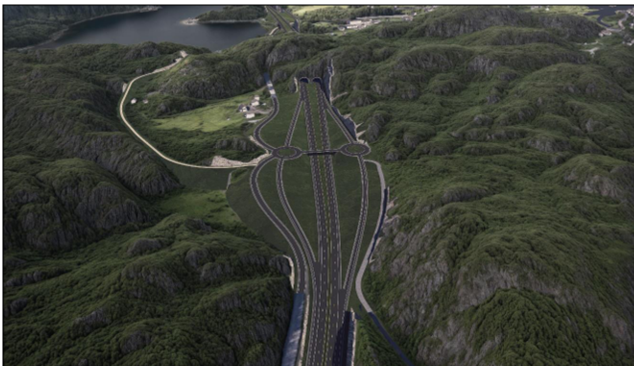
Illustrasjon av planlagt E18 og kryssløsning ved Øylandsdal, sett fra Sør (kilde Sweco)

Forbi Akland planlegges E18 på vestsiden av dagens E18, mot Aklandstjenna. Planlagt E18 vil legges oppå eksisterende veifylling mot Aklandstjenna, og det skal unngås utfylling i vassdraget så langt det er mulig. Løsningen vil gi lengre avstand til eksisterende bebyggelse, enn dagens E18, og på den måten begrense arealinngrep og støy. Dagens E18 opprettholdes som sidevei.