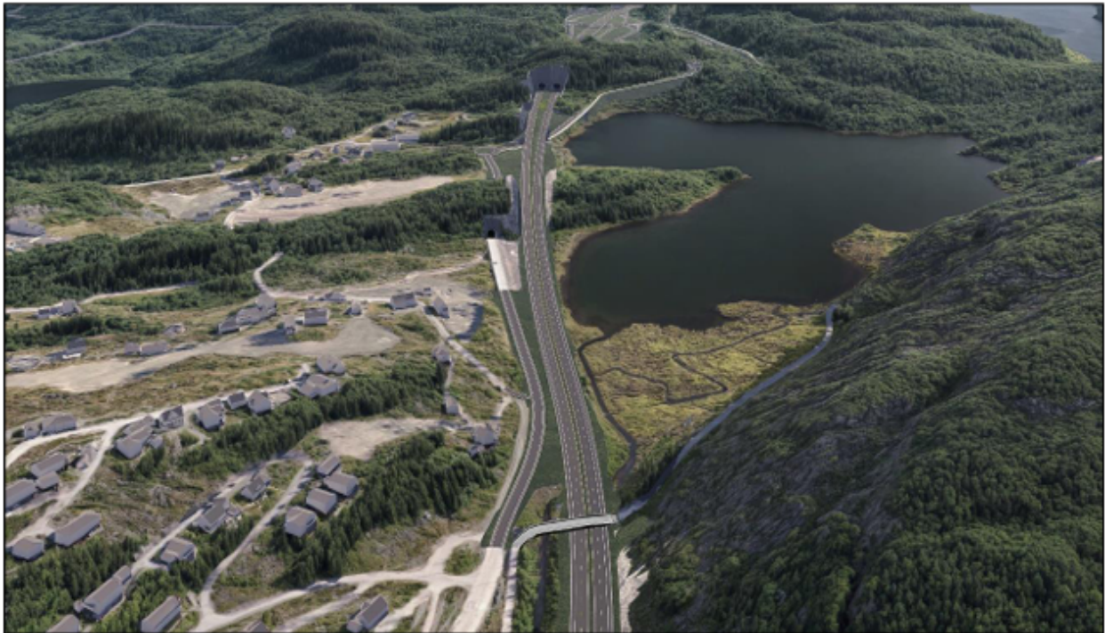
Illustrasjon av planlagt E18 ved Akland, sett fra nord