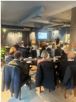
Her bilde fra Bærekraftsforum under Kultur- og bærekraftsuka på Blå kors- Mulighetens hus.

Erfaringene fra 2025 viser at Bærekraftsforum har styrket samarbeid, bygget tillit og bidratt til mobilisering av nye ressurser. Forumet har fungert godt som en mellomfase mellom arena og nettverk, med rom for fordypning, relasjonsbygging og utvikling av konkrete initiativ som tas videre i samskapingsarbeidet. Samlet vurderes resultatene som relevante og godt forankret, med tydelig potensial for videre arbeid innen sosial bærekraft og inkludering.