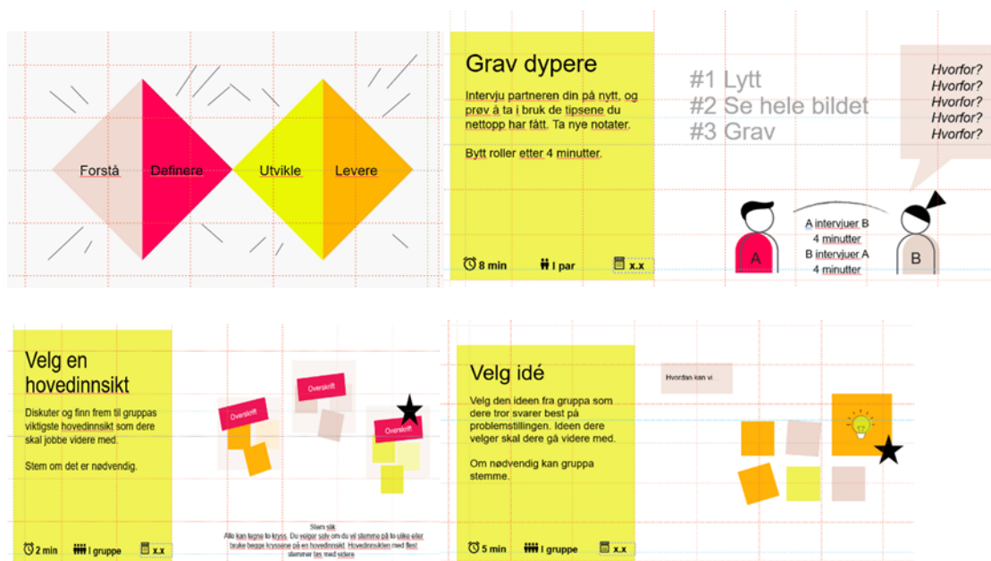
Bilde viser utklipp fra verktøy i Doga metodikken

Likeverd i samskaping forstås ikke som lik økonomisk innsats eller formell rolle, men som likeverdig deltakelse i prosessene – uavhengig av om man deltar som innbygger, frivillig, ansatt eller politisk valgt.