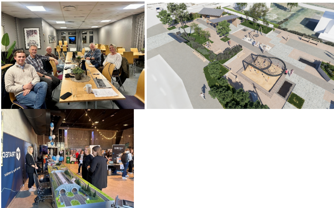
Til venstre fra stiftelse møte 3. desember 2025, Venneforening for Vennesla sentrums. Midten utkast til tegninger Graslia sanse og aktivitetspark og fra Kultur- og bærekrafts uka, Næringslivets dag til høyre.

Et tydelig eksempel på utvikling fra prosess til varig strukturen er arbeidspakken Venneforening for et område , som i 2025 har utviklet seg til Venneforening for Vennesla sentrum , med arbeidsgrupper for Graslia sanse- og aktivitetspark og Graslia minnespark . Eksempelet viser hvordan samskaping kan gå fra idé og testing til varig organisering, med kommunen i en støttende og tilretteleggende rolle.