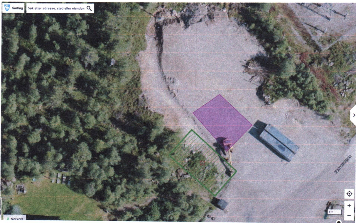
Situasjonsbilde som viser to blå fraktcontainere, grønnskavert byggeområde og lilla område der byggeområde er ønskt flytta til.