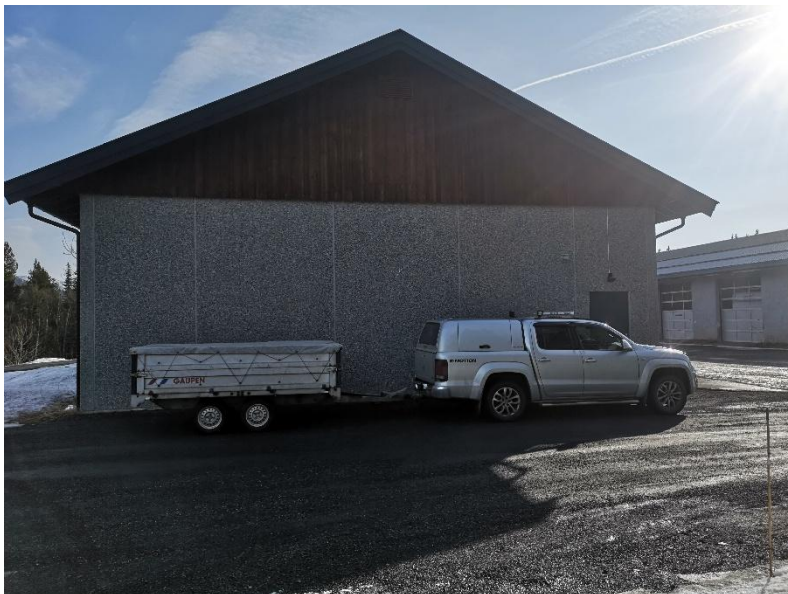
Bilde nr 1