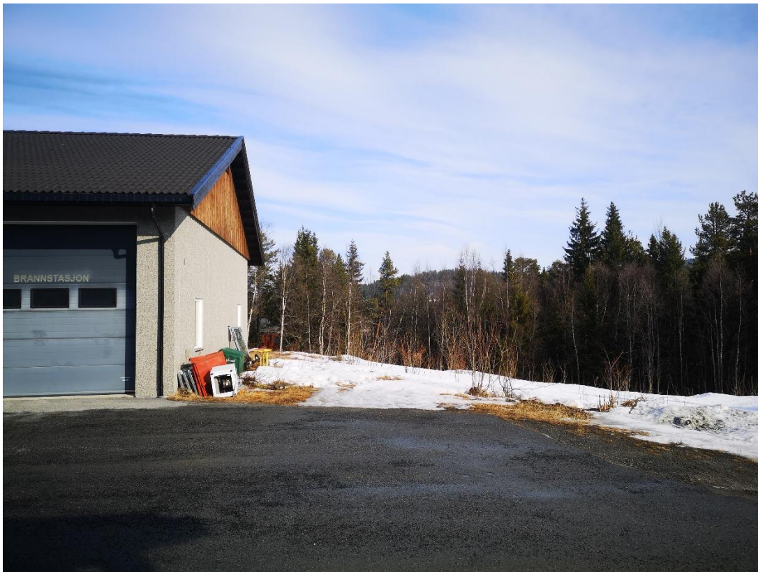
Bilde nr 2