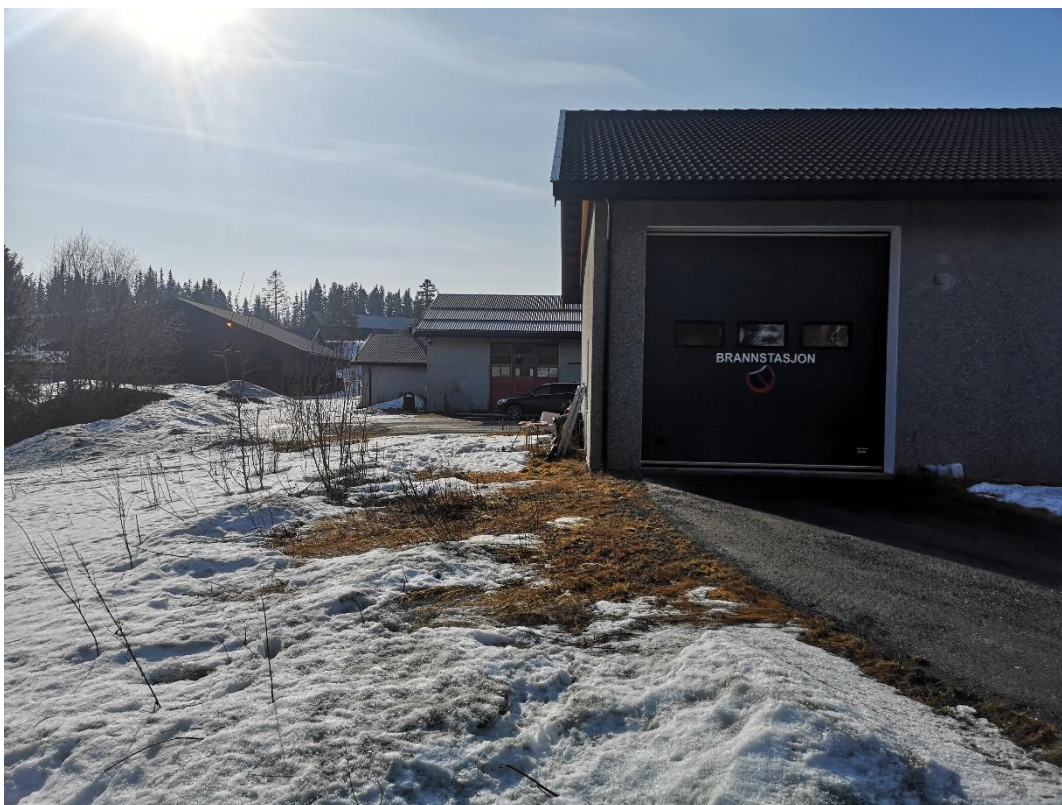
Bilde nr 3